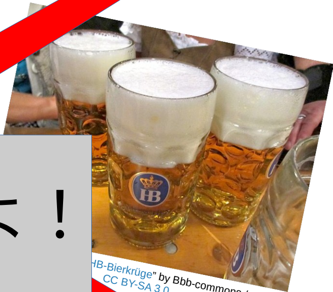
"HB-Bierkrüge" by Bbb-commons / CC BY-SA 3.0