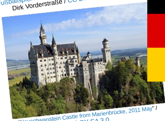
"Neuschwanstein Castle from Marienbrücke, 2011 May"