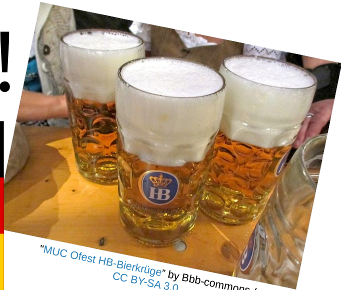
"MUC Ofest HB-Bierkrüge"