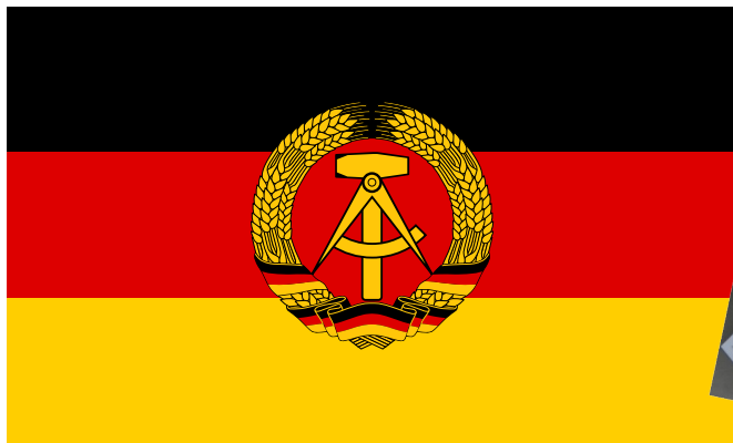
"Flag of East Germany" by Jwnabd / public domain