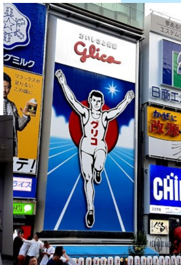
Glico by Christian Horn / CC BY 3.0