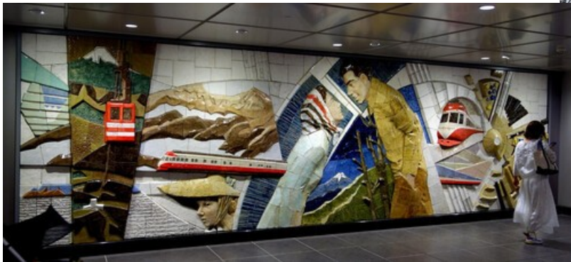
Shimokita Odakyu relief by Christian Horn / CC BY 3.0