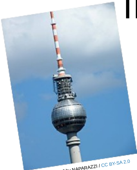
"Fernsehturm Berlin"