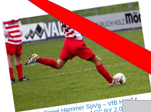
"Fußballspiel Hammer SpVg – VfB H...