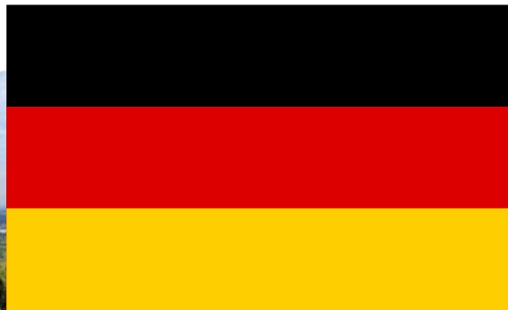
"Flag of Germany" / public domain