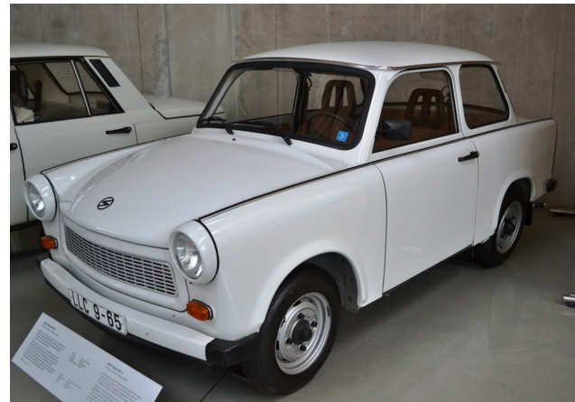
Trabant and by "High Contrast" / CC BY 3.0 DE