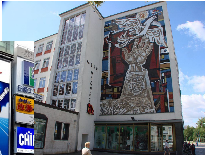
Image Eisenhüttenstadt