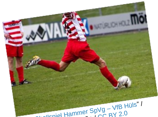
"Fußballspiel Hammer SpVg – VfB Hüls"